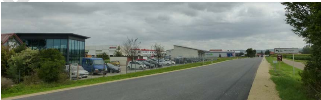
Gewerbegebiet „Enkinger Wegfeld“ von der B 25 aus gesehen, Aufnahmezeitpunkt: 08.09.2017

Aus raumordnerischer und landschaftsökologischer Sicht geht durch die Änderung des Bebauungsplans, hervorgerufen durch die Neuorientierung der Verkehrserschließung keine Umweltgefährdung, die das Vorhaben aus ökologischer Sicht als nicht realisierbar erscheinen lassen, aus. Der Umweltbericht beschränkt sich bei der Untersuchung der betroffenen Schutzgüter rein auf die Änderungsbereiche. Nach der Feststellung, dass keines der Schutzgüter durch die Planänderung beeinträchtigt wird, entfällt für die 2. Änderung des Bebauungsplans „Enkinger Wegfeld“ die Behandlung der Eingriffsregelung.