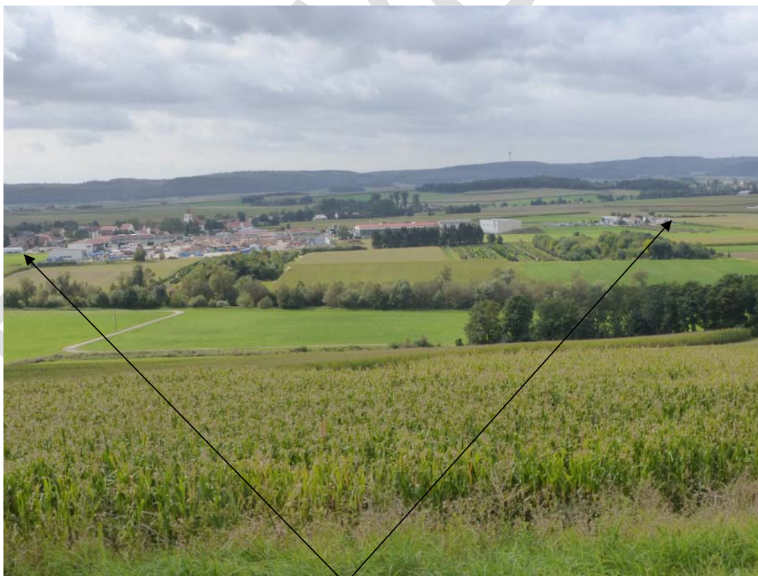
Blick auf das Gewerbegebiet „Enkinger Wegfeld“ vom Abhang des Hahnenbergs aus, Aufnahmetag: 08.09.2017

Im Bereich des Planungsgebiets sind bislang keine Altlastenverdachtsflächen bekannt.