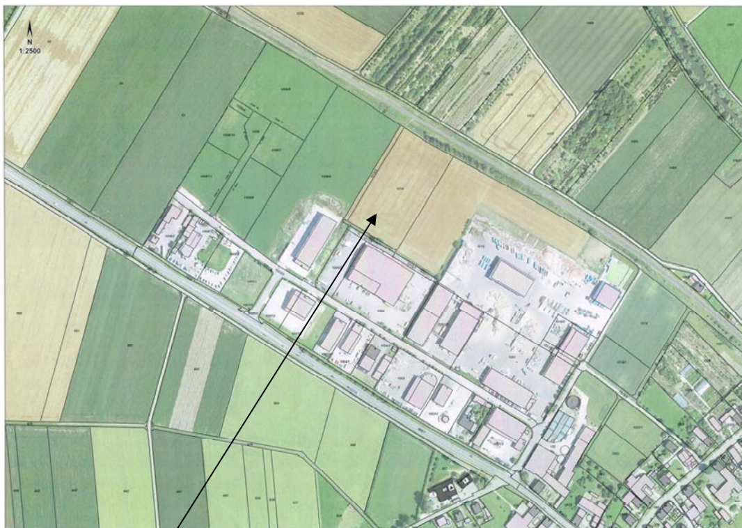
Gewerbegebiet „Enkinger Wegfeld 2. Änderung“ mit Bebauungsstand 2017, Darstellung unmaßstäblich

Das nachfolgend eingefügte aktuelle Luftbild zeigt den Entwicklungsstand der Gewerbeansiedlungen und die vorgesehene Neueinteilung der noch nicht bebauten Flächen.