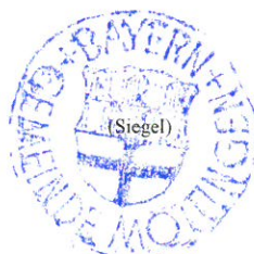
(Timo Böllmann, 1. Bürgermeister)